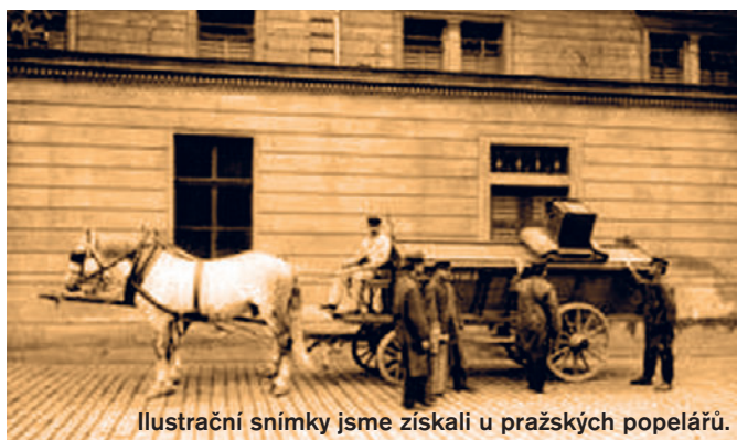
Ilustrační snímky jsme získali u pražských popelářů.